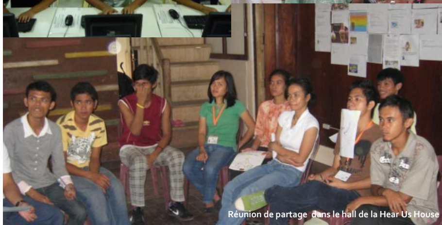
Réunion de partage dans le hall de la Hear Us House