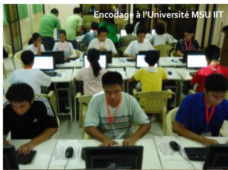
Encodage à l'Université MSU IIT